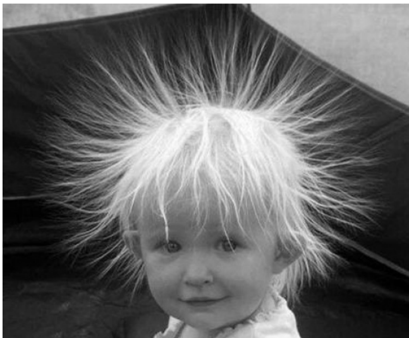
Snijeg pade na behar, na voće Nek se češlja kakogod ko hoće

Ova se poslovice danas koristi kad imaš voćnjak, pa ga napadnu sive baje, a ti behar trpaš u njedra.