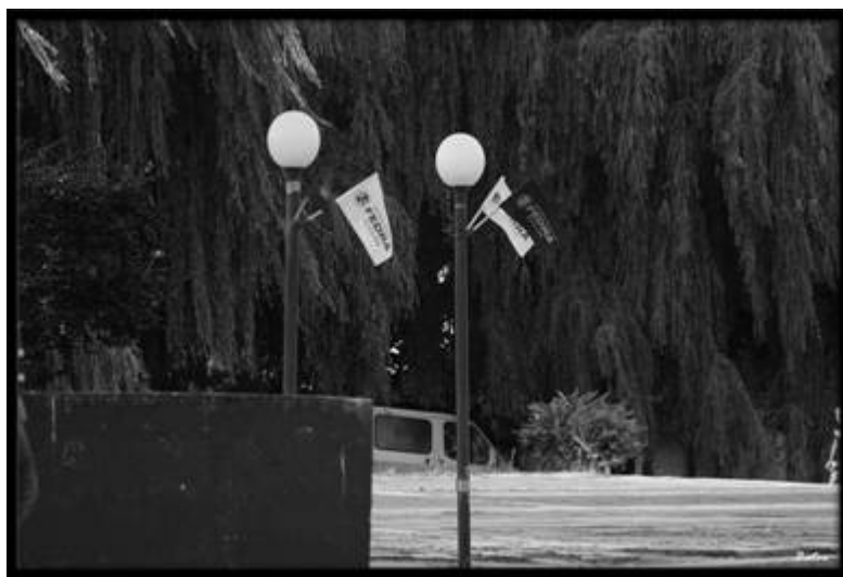
Ovo su žute i plave zastave. Samo da naglasimo.